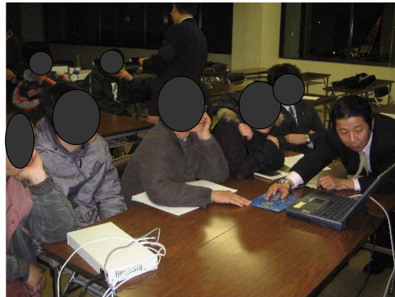
加世田本町通り振興組合「商店街活性化支援事業」支援