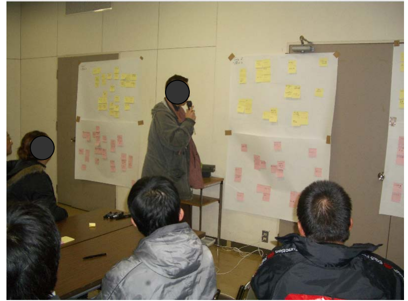
加世田本町通り振興組合「商店街活性化支援事業」支援