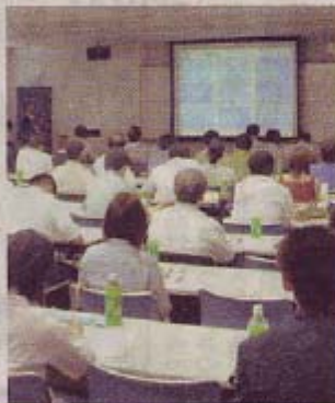
電子商取引について学んだセミナー ＝2日、鹿児島市