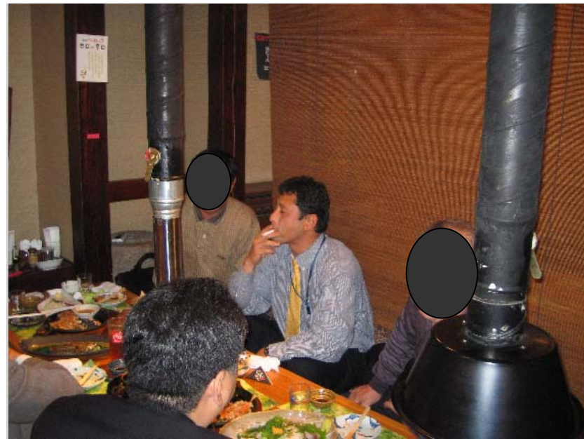
加世田本町通り振興組合「商店街活性化支援事業」支援